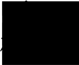
Dra. [Redacted] Jefa UTPR-UB Universitat de Barcelona