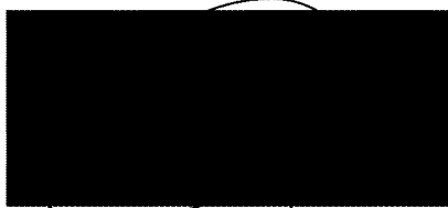
Dra. [Redacted] Supervisora IR-2376 Facultat de Belles Arts