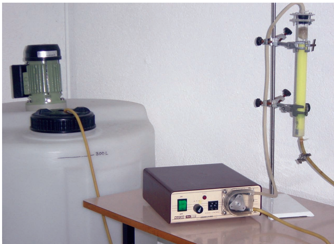
Figura 3.- Dispositivo experimental para la extracción del cesio de una muestra acuosa mediante su adsorción en una columna de AMP - gel de sílice