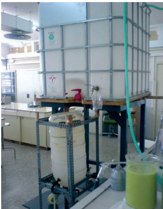
Figura 2.- Dispositivo experimental para la extracción del cesio de una muestra acuosa mediante su coprecipitación con AMP